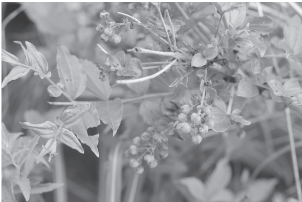
図1. 実を付けたドクウツギ(山北町世附で撮影)

海藻として、あまのり, あをのり, ひじき, あらめ, わかめ, てんぐさ(以上, 食用), かじめ, ほんだはら(以上, 肥料用), つのまた, ふのり(以上, 工業用)が挙げられている。